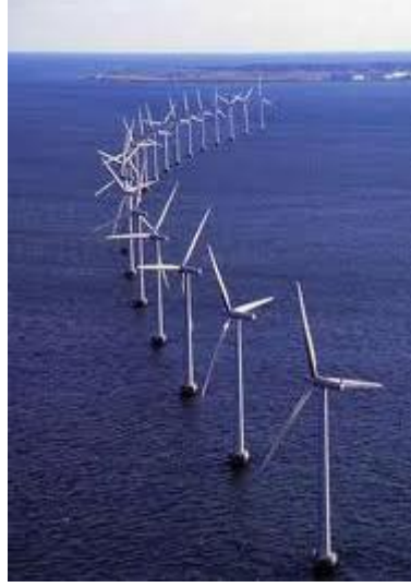
Resim 2.3: Denizüstü (offshore) rüzgar santrali- denizüstü rüzgar türbinleri

Ayrıca denizlerde daha kesintisiz ve daha güçlü rüzgar olması nedeniyle deniz üstü rüzgar santralleri kurulmaya başlanmıştır.