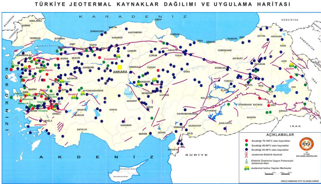
Resim 2.4.: Türkiye'de jeotermal enerji

Doğal yeraltı ısı kaynaklarından gelen enerjinin kullanımı hızla artmaktadır. Sıcaklığın uygun olduğu şartlarda jeotermal enerjiden elektrik üretilmektedir.