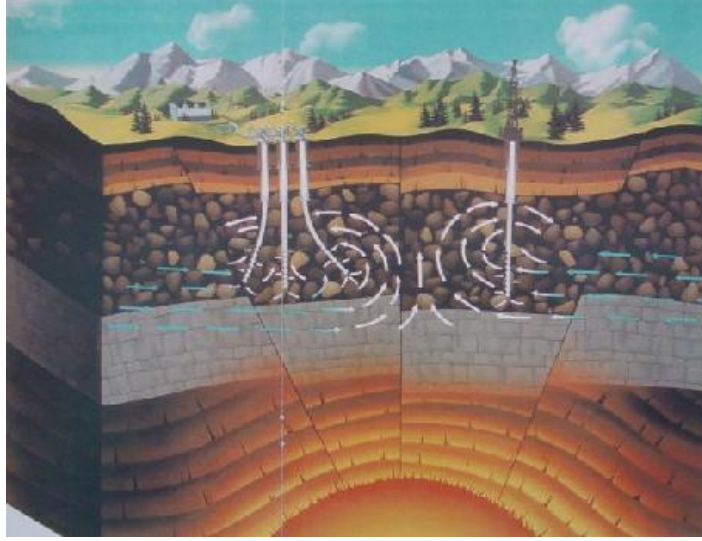
Resim 2.6: Jeotermal sistemdeki rezervuar, üretim ve reenjeksiyon

Su ve buharın çözdüğü minerallerden geçen iyon ve gazların çevre kirliliğine neden olmaması için bu sular ısı değiştiriciden geçirilir ve içerdikleri kükürtdioksit, hidrojen-sülfür, karbondioksit ve azotoksitleri ise enerjisinden yararlanan artık su ile tekrar yeraltına gönderilir (Reenjeksiyon). Jeotermal enerjinin üretimi sırasında çıkan su tekrar yeraltına pompalanırsa (Reenjeksiyon) yerüstü sularına oranla daha fazla erimiş mineral, çeşitli tuzlar ve gazlar nedeniyle kirliliği kabul edilen hali ortadan kalkar; temiz ve yenilenebilir hale gelir. Böylece çevreye karşı olumsuz etkisi de önlenebilir.