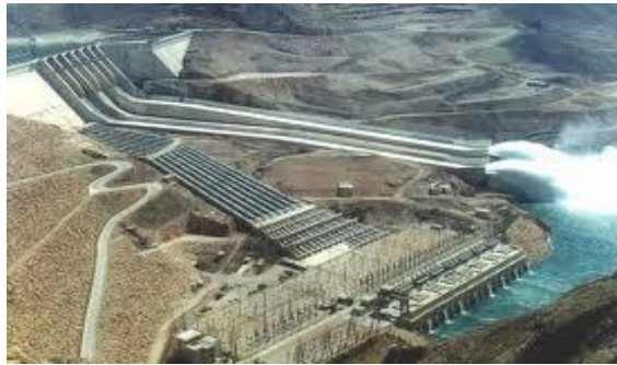
Resim 2.8: Hidroelektrik enerji santrali

Bir megavat kurulu güçten aşağı olan hidroelektrik yapılara küçük hidroelektrik santralleri (KHES) adı verilir. Bunlar büyük düşü (suyun yüksekten düşürülmesi ilkesi ile elektrik üreten) barajları gerektirmeden küçük akarsulara kurulabilen, küçük yerleşim yerlerine elektrik enerjisi sağlayan türbin düzenekleridir.