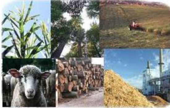
Resim 2.7: Biyokütle Enerjisi

Şehir katı atıkları iyi bir biyokütle enerji kaynağıdır, ama doğası gereği şehir çöplerinde organik ve inorganik maddelerin karışık olması nedeniyle ayırma işlemi yapılmalıdır.