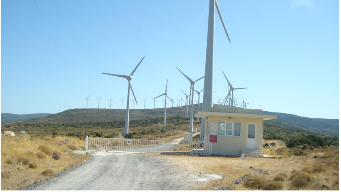
Resim 2.2: Rüzgar enerjisi santrali

Rüzgar enerjisinden yararlanma fikri insanlı tarihinde çok eskilere dayanmaktadır; Su ve rüzgar değirmenleri dünyanın ilk endüstrilerine güç sağlamıştır. Rüzgar enerjisinden elektrik üretimi ilk kez 1891 yılında Danimarka’da gerçekleştirilmiştir. 1990’dan Son yirmi yıldan beri dünyada en hızlı gelişen yenilenebilir enerji kaynağı rüzgar enerjisidir. Bu gelişmenin altında yatan en önemli etkenlerden biriside verimlerinin yüksek (% 59 civari) olmasında yatmaktadır.