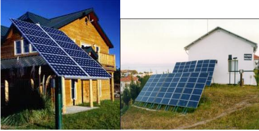
Resim 2.1: Güneş Panelleri

Güneş enerjisinin günlük yaşamın ayrılmaz bir parçası olması nedeniyle verimli olarak kullanılabilmesi amacına yönelik Ar-Ge (araştırma-gelistirme) çalışmaları her geçen gün artmakta ve bu enerji kaynağının yaygın olarak kullanılabilmesi çalışmalara devam edilmektedir.