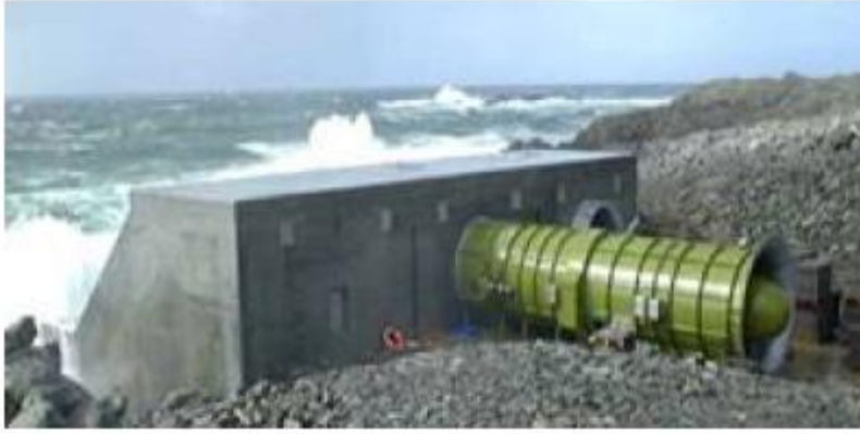
Resim 2.10: Deniz dalga jeneratörü

Gelgit enerjisi santralleriyle ilgili bugünkü tasarımlar, gelgit genliğinin büyük olduğu belirli kıyı kesimindeki ırmak ağzına ya da deniz girişine bir baraj yapılmasına dayanır. Eğer bu barajın içine bazı tüneller açılırsa, sular yükselme zamanında bunlardan içeri girecek, alçalma zamanında da dışarı akacaktır. Tünellerin içine yerleştirilmiş olan türbinler de suyun akışıyla dönecek ve buna bağlı olan jeneratörlerden elektrik üretilmiş olacaktır. Gelgit olan bölgelerde, kabarma ve alçalma hareketlerinden kanatları ters yönde de dönebilen türbinler yoluyla elektrik üretilmesinin dünyada en önemli örneği Fransa'da Rance ırmağının halicinde kurulmuş olan 750 m uzunluğunda ve 240 MW gücündeki gelgit barajıdır. 1966 yılında inşa edilen bu barajda 24 pervane türbin bulunmaktadır.